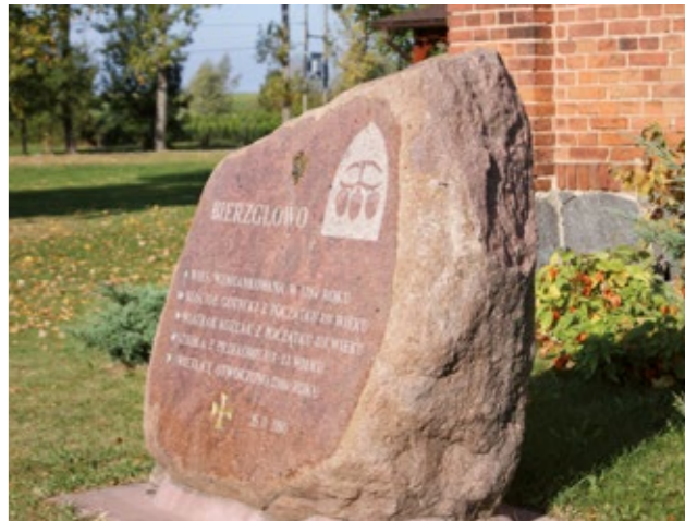
Kamień pamięci w Bierzglowie

Wiatrak bierzglowski, a właściwie młyn wiatrowy swój stan zachowania zawdzięcza ukończonej w 2011 roku rekonstrukcji. Jest jednym z najcenniejszych zabytków dawnej kultury wiejskiej na terenie gminy Lubianka oraz na całej dawnej ziemi chełmińskiej.