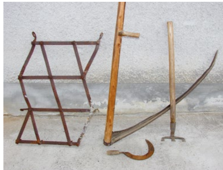
Narzędzia rolnicze: brona, kosa, sierp, motyka

Dawne narzędzia rolnicze stosowane na Kujawach: pług, radło, cep, motyka, sierp, kosa, brona. Do połowy XIX wieku narzędzia rolnicze były bardzo prymitywne, występowały drewniane pługi, radła, które pod względem formy i kształtu powstały jeszcze za czasów feudalnych.