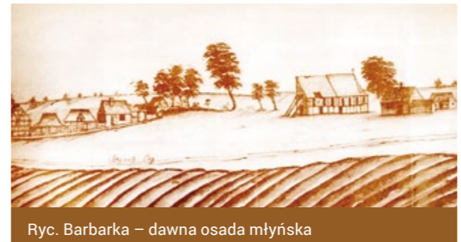
Ryc. Barbarka – dawna osada młyńska

Do 1415 roku młyn należał do Komturstwa Bierzglowo, a następnie do Komturstwa Toruń.