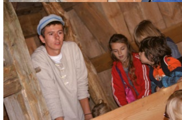
Zajęcia edukacyjne w wiatraku