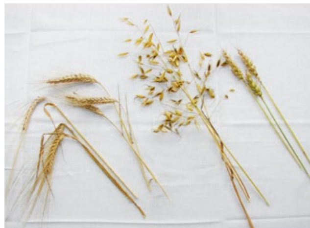
Zboża: jęczmień, owies, pszenica

Chleb, zwłaszcza w Polsce, cieszył się wielkim szacunkiem. Mówiono, że chleb to w domu władarz, w pracy przyjaciel, w drodze towarzysz.