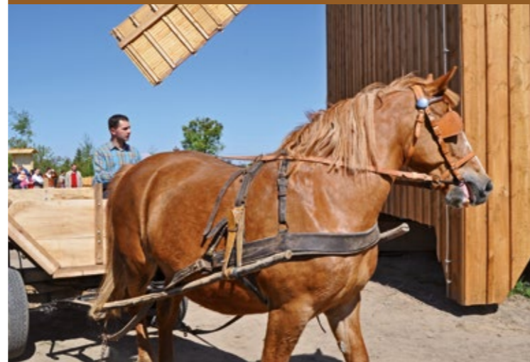
Przejażdżka konna wokół wiatraka